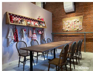
ミニーマウス デザイン 個室