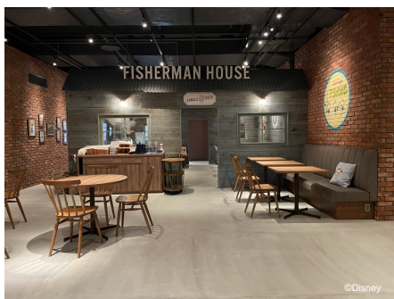
「Fisherman House」をテーマにした ドナルドダック デザインのカフェ店内ゾーン