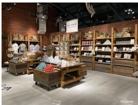
ギフトショップ (店内エントランス入ってすぐ)