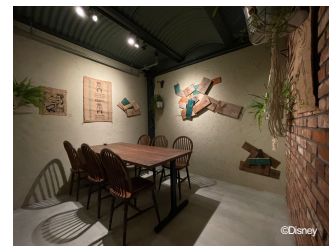
グーフィーデザイン 個室