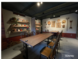
ミッキーマウス デザイン 個室