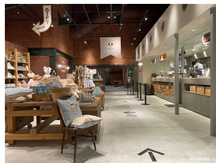
オープンキッチン (写真：右)