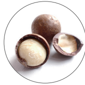
マカデミア種子油*2