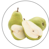
乳酸桿菌/セイヨウナシ果汁発酵液*2

ゴワついた肌にうるおいを与え、やわらかく整える“乳酸桿菌/セイヨウナシ果汁発酵液*2”をはじめとした4種のうるおいキープ成分*3が、お風呂上がりの肌をラッピング。乾燥から肌を守り、みずみずしさを保ちます。