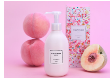
※濡れた肌に使えるボディ乳液第一弾 「meshimase ボディミルク(ピーチの香り)」

また、ボディケアは面倒な部分もありますが、楽しみ・ご褒美にもなるケアであり、香りや見た目の重要性も非常に高いものと考えています。meshimaseシリーズではお手入れの手軽さや機能性だけでなく、香りや見た目の可愛さなどの情緒的価値も同じくらい高いものを目指しました。