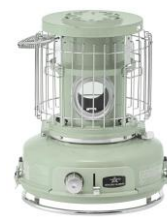
Sengoku Aladdin ポータブル ガス ストーブ SAG-BF02(G)

アラジンのブルーフレームをモチーフにした コンパクトサイズのガスストーブ。 ※燃料はカセットボンベ