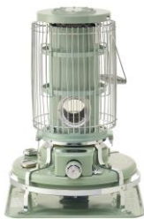
Aladdin ブルーフレーム BF3911(G)