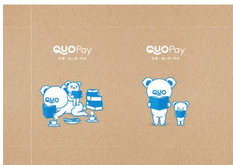
キャンペーン限定ブックカバー

またキャンペーン実施店舗では、QUOカードPay公式キャラクターの「クオとペイ」が読書をしているデザインの限定ブックカバーとしおりも配布します。