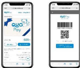
スマホ画面表示イメージ