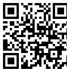
「彩響」特設サイト QR コード