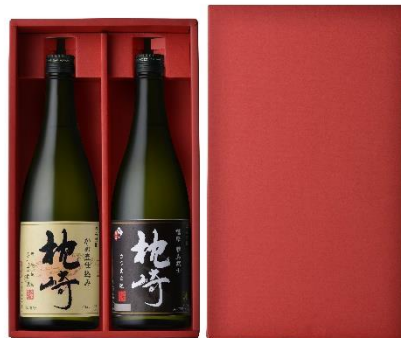
2020年 TWSC 最高金賞受賞の かめ壺仕込みの本格芋焼酎『枕崎』 との限定セットも登場

鹿児島県の南端に位置する枕崎市は、温暖な気候で、海と山に囲まれた自然豊かな地域です。中でも、日本一の生産量を誇る鯉節と、古くから薩摩地方に伝わる薩摩焼酎造りの盛んな街として知られています。市内には40軒以上の鯉節屋が点在し、温泉街のようにあちこちで鯉節を燻す煙が立ちのぼっているため、かつおだしを思わせる芳醇な香りが、ほんのりと街全体に広がっています。