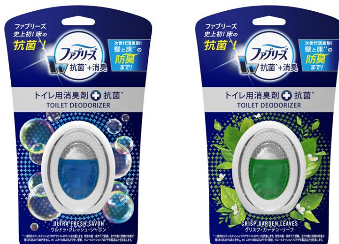
<写真左から>ファブリーズ W 消臭 トイレ用消臭剤+抗菌 *1 ウルトラ・フレッシュ・シャボン、同クリスパ・ガーデン・リーフ