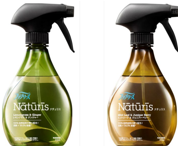
<写真左から>ファブリーズ ナチュリス レモングラス&ジンジャー、同ミントリーフ&ジュニパーベリー