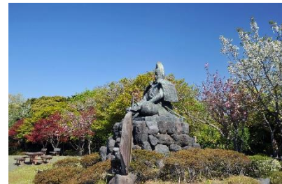
神奈川県鎌倉市(源氏山公園)

デマンド乗合タクシーは、MONET のオンデマンドモビリティサービスを活用するため、観光客はスマホアプリで希望の乗車日時と乗降場所を選択して簡単に予約することができます。また、今回は、観光客の分散周遊に繋がり、より多くの観光スポットを巡っていただくための取り組みとして、デジタルスタンプラリーによる買物割引券などの特典を提供します。JTB と MONET は、鎌倉市観光協会の協力を得て開発した「鎌倉観光周遊パス」の提供により、鎌倉エリアの新たな魅力発見へ繋がる取り組みを進めていきます。