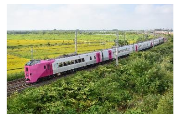
貸切列車と菜の花畑(イメージ)