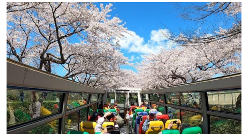
JTB 北斗桜回廊バス(イメージ)

ホームページ: https://tabisugo.jtb.co.jp/regions/1