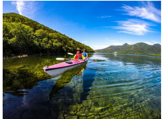
然別湖シーカヤック(イメージ)

新型コロナウイルスの影響によって、観光事業者を取り巻く環境も旅行のスタイルも変化しています。そうした環境変化に適応した北海道の新しい旅の楽しみ方として「自然」、「アクティビティ」、「異文化」を体験するアドベンチャートラベル(AT)*とサステナビリティ推進による交流創造を広く発信してまいります。