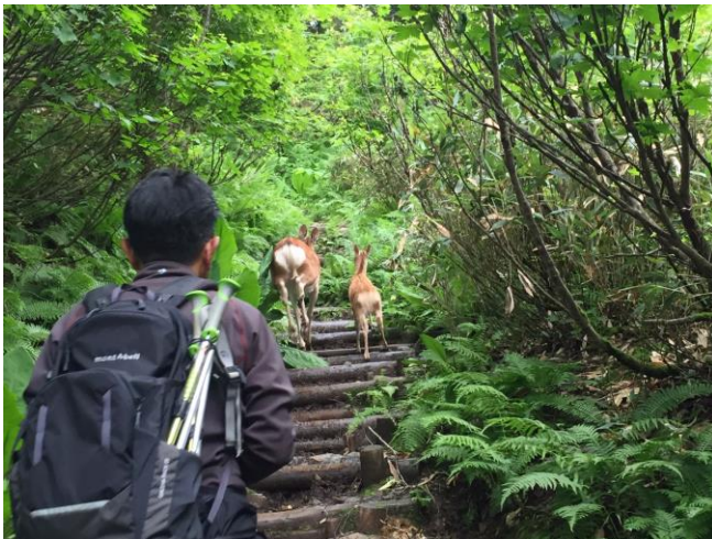
大雪高原温泉沼めぐりトレッキング(イメージ)

「日本の旬 北海道」公式ホームページ： https://www.jtb.co.jp/nihonnoshun/hokkaido/