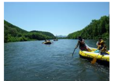
空知川 川下り(イメージ)

https://dp.jtb.co.jp/lookjtb/dp/pamphlet/2023_jtb_9950002/#4