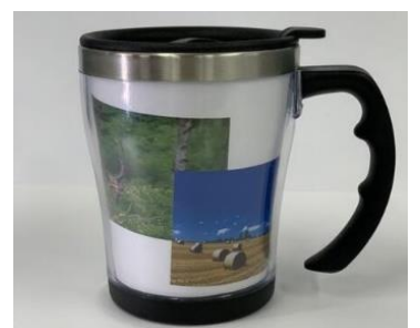
マグカップ(イメージ)