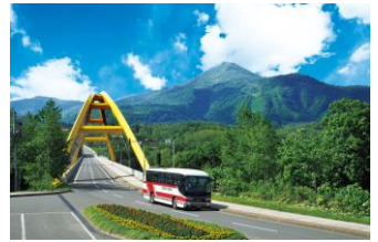
北海道中央バス(イメージ)

https://www.jtb.co.jp/pamphlet/index.asp?kubun=kokunai&dep=TYO&area=010