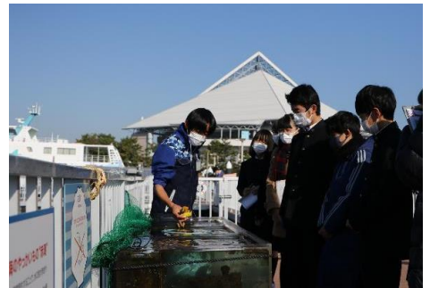
東京湾ワンダーウォッチャーズ(体験イメージ)