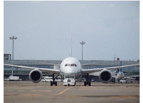
羽田空港(イメージ)