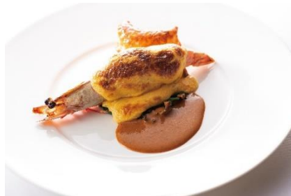
海老と舌平目のグラタン“エリザベス女王”風(イメージ)