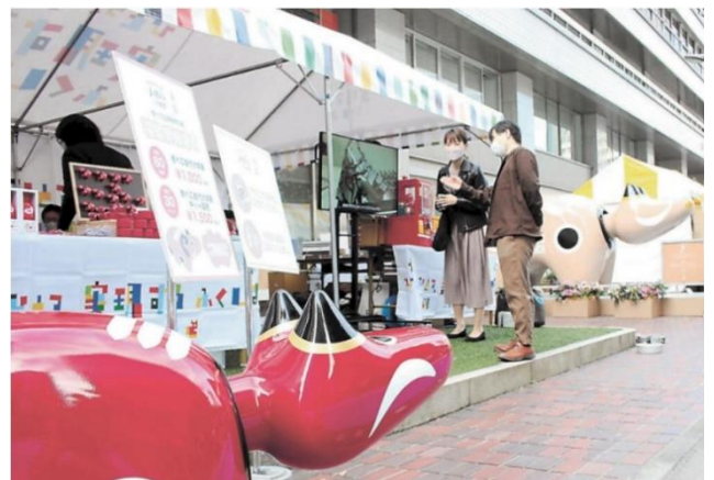
▲ふくしま情報発信イベント