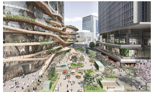
▲街区完成後の TOKYO TORCH Park 全景(東京駅側より)

連携協定第一弾の取り組みとして、株式会社 JT B が首都圏における観光プロモーションの企画運営を受託している熊本市(熊本市東京事務所)と連携し、TOKYO TORCH Park や常盤橋タワーを活用した熊本の魅力を体感するイベント等を2022年夏以降に実施する予定です。