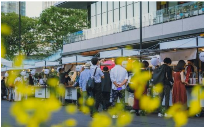
▲全国から工芸の産地が集う「Onland Craft Market」