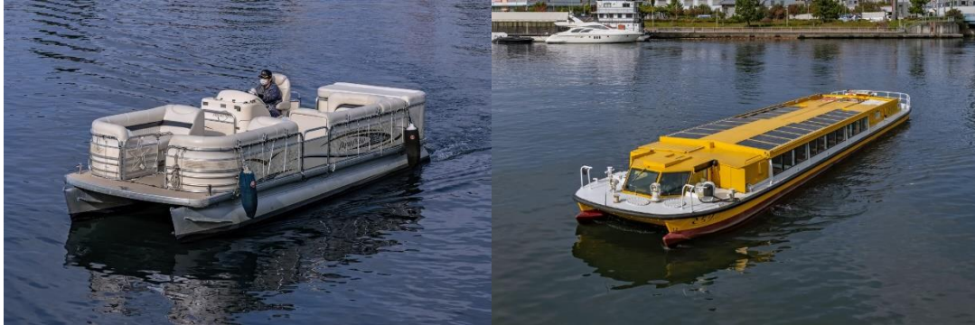
左:小型船、右:大型船(いずれもイメージ)