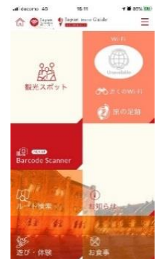
【アプリ QR コード】 【アプリイメージ】

※アプリダウンロード特典としてお一人様1つずつ入浴錠を雪国観光舎(越後湯沢温泉観光協会・松之山温泉里山ビジターセンターにてお渡しいたします。