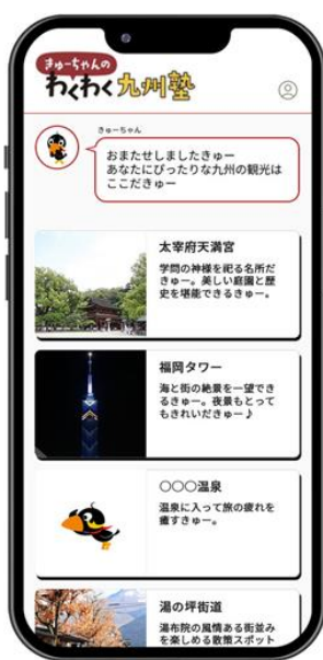
生成AIが観光スポットをレコメンド！