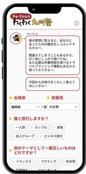
簡単なアンケートに答えると