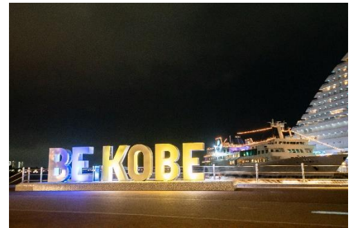
ルミナス神戸(イメージ)

・主催者様のロゴマークやメッセージをドローンで表現する PR(プロモーション)の実施も可能です。