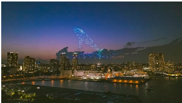
洋上のドローンショー(イメージ)

2025年大阪・関西万博を見据え、訪日外国人観光客を含む国内外の団体のお客様向けに新たな神戸の夜の楽しみ方を提案し、神戸の魅力を知っていただくことで神戸への MICE ※1 誘致促進に貢献します。