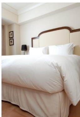
帝国ホテル 東京「インベリアルフロア」で使用の オリジナル寝具ブランド「スリープワークス」

・商品詳細ページ： https://luxurytravel.jtb.co.jp/tour domestic/1ggy006-5/