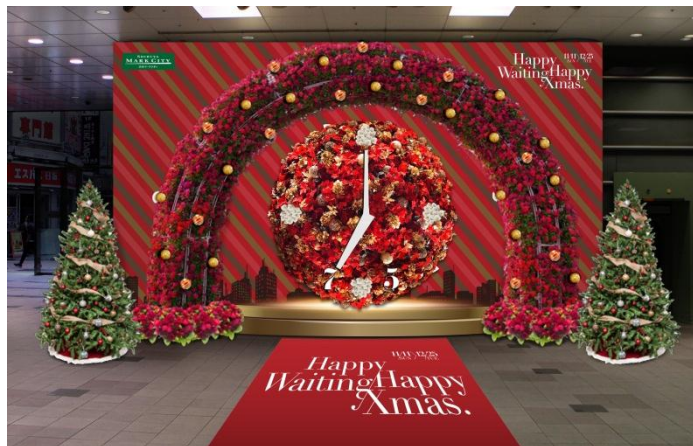
▲展開イメージ。思わず写真に撮りたくなる インパクト絶大な大型フラワークロック

https://www.universal-music.co.jp/nomiya-maki/