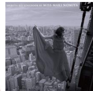
▲アーティスト野宮真貴の楽曲で 幸せな待ち合わせ時間を演出！