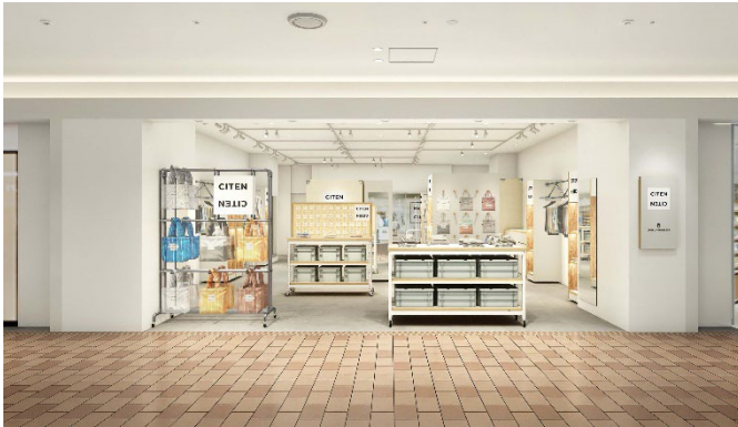
店舗イメージパース

各店舗ともウィメンズ・メンズのウェア、バッグ、シューズやアクセサリ等の雑貨を中心に展開します。白とグレーを基調とした内装に木、スチール、布の素材を取り入れることで柔らかさや温かさを醸成し、お客様が気軽に入店しやすい空間設計にしています。