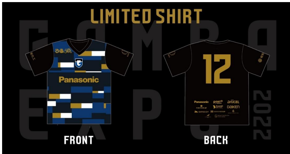
・来場者配布シャツ