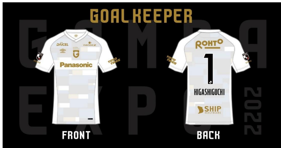
・ゴールキーパーユニフォーム