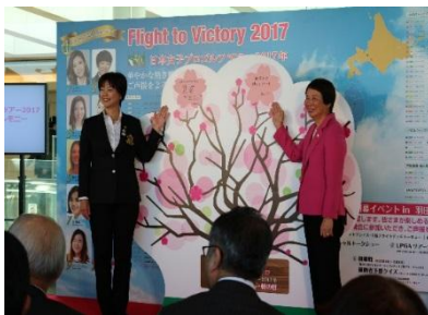
※2017年実施の開幕式の様子

本イベントでは、初日に本ツアーの各大会の成功を祈願する開幕式、および2018年シーズンの見どころや期待の選手を交えて語るスペシャルトークショーを実施する他、『ゴルフをもっと日常に』をスローガンに子供から大人までゴルフの楽しさや面白さを体験できるゴルフ体験ゲームイベント（2月24日～2月25日）を開催するなど、女子プロゴルフの魅力や楽しさを存分にお楽しみいただけるコンテンツを多数ご用意しております。訪日外国人の増加が見込まれる2020年に向け、世界の玄関口として更なる飛躍を遂げていく羽田空港を舞台に、女子プロゴルフの魅力や楽しさを発信してまいります。