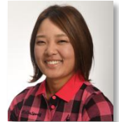
プロゴルファー 鈴木愛