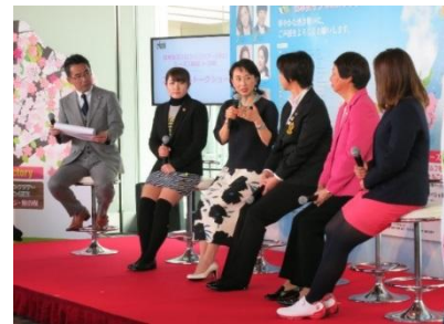
※2017年実施のトークショーの様子