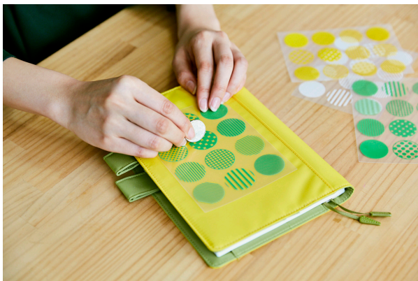
手帳をデコレーション (ポリエステル)