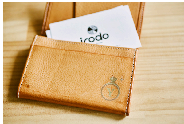
カードケースをデコレーション (本革)