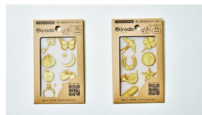
ラッキーモチーフ①、②