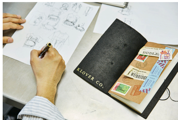
トラベラーズノートをデコレーション (本革)