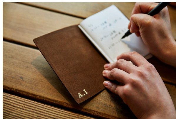
手帳 (内側) をデコレーション (本革)