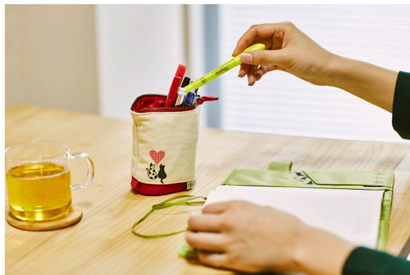
ペンケースをデコレーション（キャット）