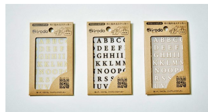
アルファベット (セリフ)