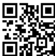
irodo 公式 WEB