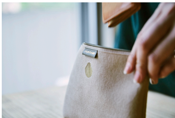
ポーチをデコレーション (スエード)