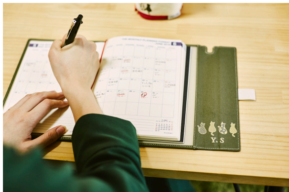
手帳をデコレーション（ポリエステル素材）

お客様のご要望が多かった大人文具のデコレーションに使える『モチーフ』をテーマにデザイン・カラーリングを作成しました。新しいペンケースを自分だけのオリジナルアイテムにデコレーションしたり、長年使い続けた革手帳にお気に入りのシールを貼ったり。友だちや親子でとおそろいのモチーフをつけたりと既製品にはないイロドリを加える新しいラインナップが増えました。