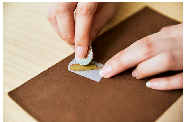
使用イメージ（本革）