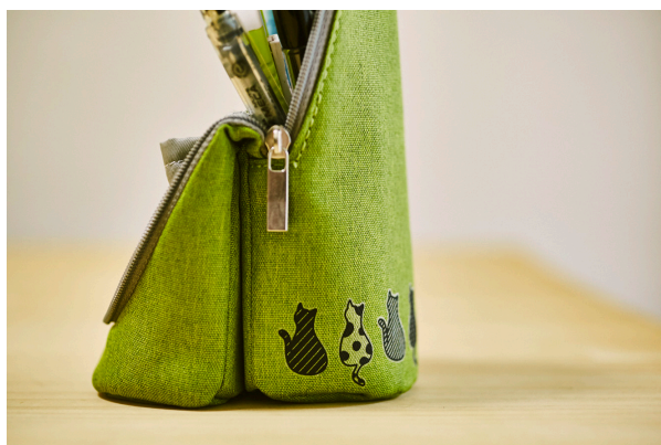
ペンケースをデコレーション (ポリエステル)