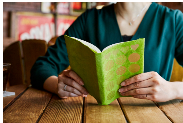
ブックカバーをデコレーション (スエード)