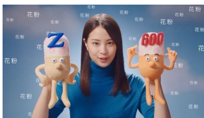
コンタックは 2 種類