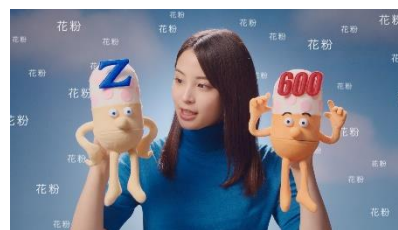
1 日 1 回だけでいい 「ゼーッ」