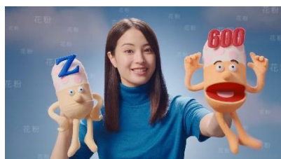
効き目の 「600 プラス」