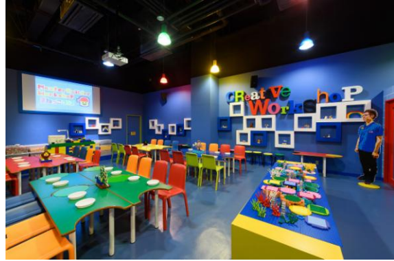
「クリエイティブワークショップ」室内