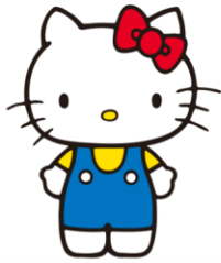
ハローキティ (誕生45周年記念オリジナルデザイン)