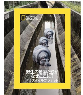
番組告知グラフィックイメージ