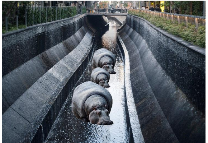
カバの親子（親×2、子×1）設置イメージ