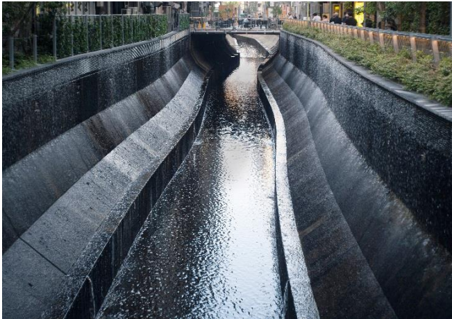
渋谷駅南側エリアを流れる渋谷川

ドキュメンタリー専門チャンネル、ナショナル ジオグラフィック（運営：FOXネットワークス株式会社、本社：東京都品川区、代表取締役：西川高幹、以下ナショナルジオ）は、地球上の最も過酷な環境と、そこに生きる野生動物の姿に迫るドキュメンタリー番組『ホスタイル・プラネット 非情の惑星』を、2019年8月22日（木）午後10時より放送いたします。そして、ナショナルジオは放送開始を記念して、近年の急激な環境の変化に耐え、熾烈な生存競争を勝ち抜くために、生き物たちは適応し続けなければならないことを知っていただくため、2019年8月24日（土）～25日（日）の2日間限定でカバが出現するプロモーション撮影を渋谷川・稲荷橋にて実施いたします。