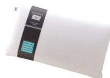
エアウィーヴ ピロー S-LINE