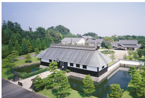
「葛城北の丸」(左:客室「藤殿」、右:ホテル全体)