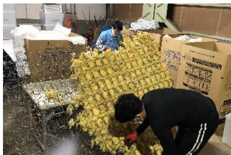
▲ 従来型スプリングマットレス廃棄の様子

環境配慮型寝具を普及させていくためには、自治体や廃棄物処理業者、地域住民といったステークホルダーとの連携が課題となっています。つくば市、幸田町との取り組みは、そういった課題を乗り越えるため自治体の補助金を活用しながら環境課題の解決に貢献するものです。