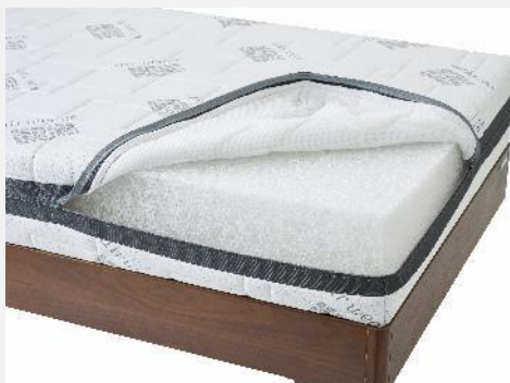
▲ カバーと中材を分解し、容易にリサイクル・リユースが可能