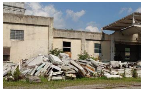
▲ 堆積された廃マットレス

都市開発が進むつくば市では、令和5年度の総務省の調査において人口増加率が全国1位※2となり、今後も転入者が増えることが予想されています。一方で、廃スプリングマットレスは年間2,500枚以上が回収され、外部委託業者による処理が追いつかず課題となっています。この度の協定では、環境に配慮した資源循環型マットレスを購入した市民の皆様へ、つくば市が購入の一部を補助することに加え、使い終えたマットレスの引き取り時に発生する費用も当社が支援することで、自治体が抱える処分時の負担を軽減し、環境配慮型の寝具へのシフトを促進します。この取り組みは6月1日より施行・運用が開始されます。