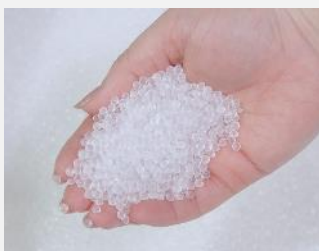
▲ リサイクル可能な素材 ポリエチレンを使用