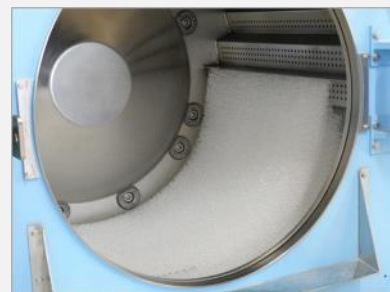
▲ エアファイバー®洗浄の様子

リサイクルにおいても、カバーは古布回収、中材のエアファイバー®は洗浄、破碎、溶融を経て、再びプラスチック素材としてリサイクルが可能です。2022年からは、使用済みの寝具を回収して再びマットレスへ製品化する「水平リサイクル」への取り組みを実施しています。