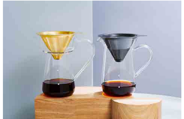
左「ゴールドコーンフィルター＆サーバーC751GD」13,200円(税込)

2021年9月に「ゴールドコーンフィルター＆サーバー C751GD」、11月に「チタンコーンフィルター＆サーバー C761GY」も発売しました。誰でも簡単にフレッシュなコーヒーアロマが楽しめるスペシャルティコーヒーに最適なアイテムです。ワイングラスのようなサーバーの膨らみ部分に蒸気と香りが充填し、ドリップ時に芳醇な香りが立ちのぼります。Cores独自のフィルターは縦長メッシュ形状で目詰まりを起こしにくく、旨みやアロマ成分をそのまま抽出するため、豆本来の香りや味わいをしっかりと感じることができます。