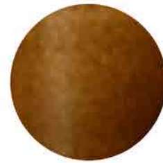
美濃伊賀 (キヤメル)

鉄釉は酸化鉄を呈色剤とした釉薬が使われている焼き物のことで、その含まれる鉄の分量によって黄褐色から黒色まで発色します。瀬戸黒も鉄釉の一種です。