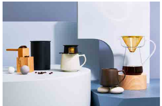
現在発売中のCoresブランド

Coresの原点でもある、純金がコーティングされた「ゴールドフィルター」は主力製品です。現在、「Coresゴールドフィルター」は市場でも独自のポジションを獲得しています。今後の商品展開でもコーヒープロダクトブランドCores独自の商品開発を行ってまいります。