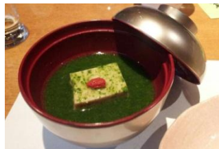
明日葉とタタキのお椀