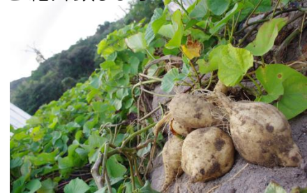
特産のあめりか芋

このイベントを通して、島との関係強化や島のさらなる発展・活性化につながれば幸いです。