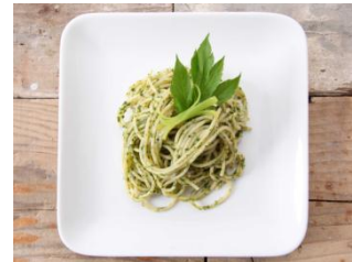
明日葉ジェノベーゼ