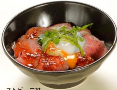
*ローストビーフ丼