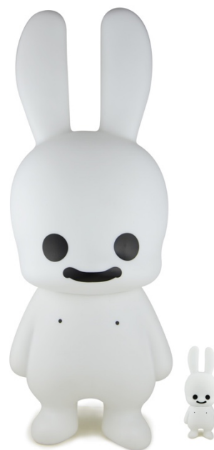
左が XXL サイズ、右が通常サイズ