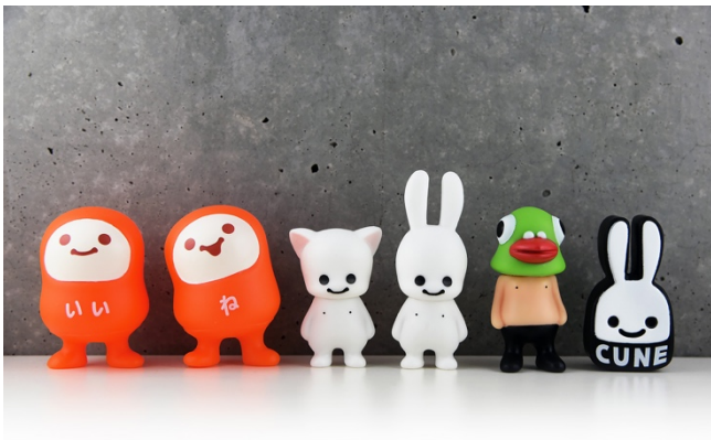
全高約 70mm サイズの通常版 正面