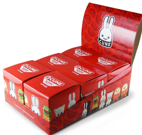
トレーディングボックスで販売致します