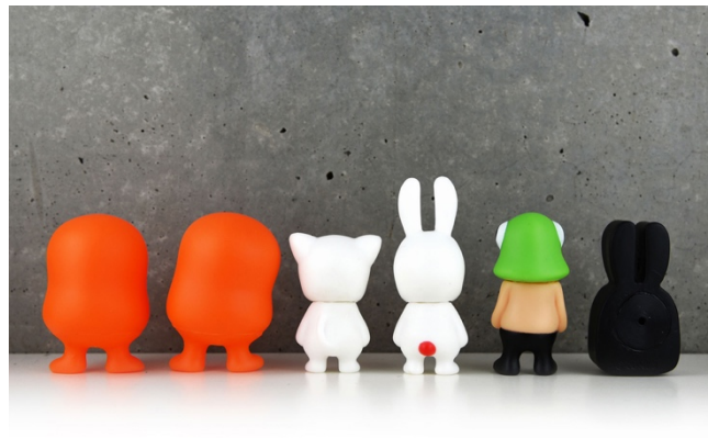
全高約 70mm サイズの通常版 背面