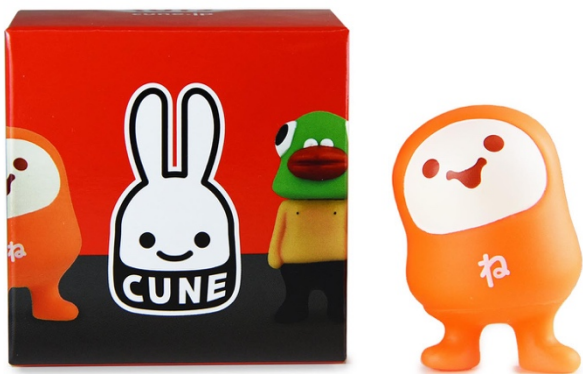
1箱に1つのソフビ入りです