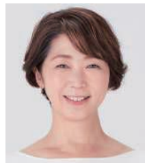
司会 中井 美穂 (フリーアナウンサー)

日時 2023年 3月19日(日) 13時開場 14時開演 東京芸術劇場(東京・池袋)