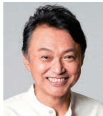
相島 一之 (俳優)