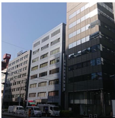
新オフィスが入るヒルコート東新宿ビルの外観

コーポレートサイト: https://corp.senior-job.co.jp/