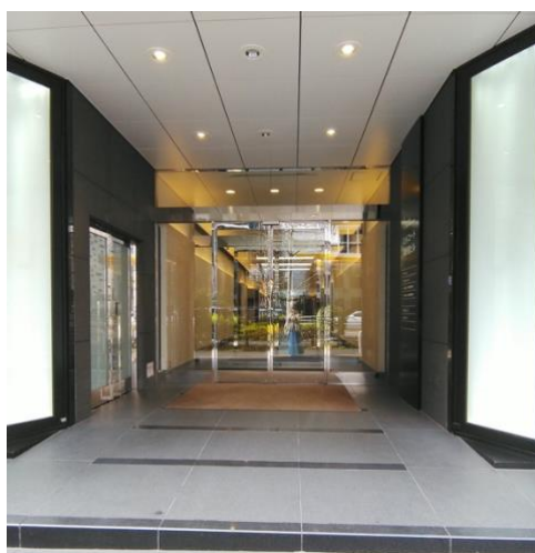
ヒルコート東新宿ビルのエントランス