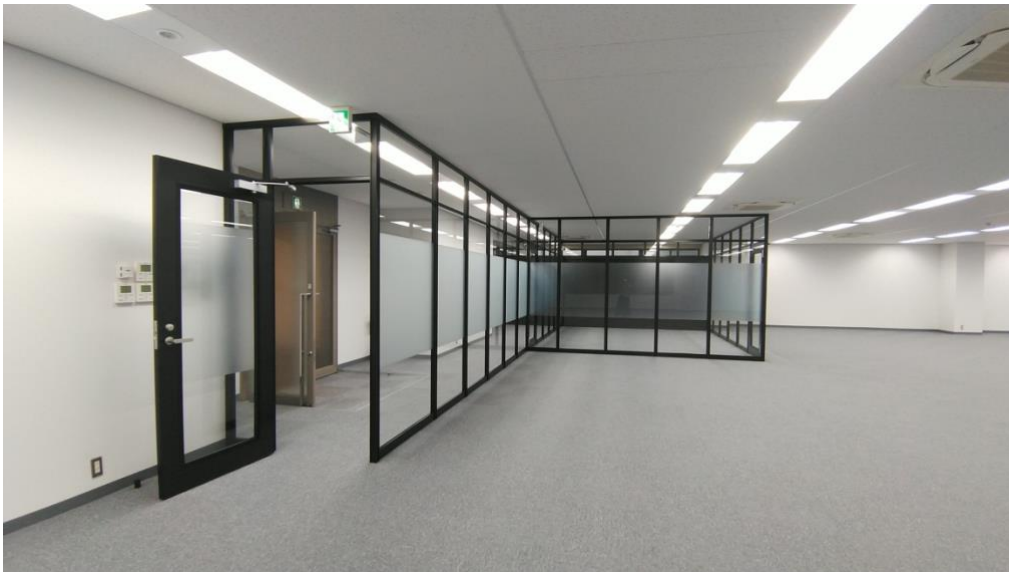
シニアジョブ新オフィスのエントランスとミーティングルーム。くもりガラスのパーティションで十分な広さをさらに活かす。

会社の「のびしろ」を大きく想定した上で、旧オフィスの約 4 倍の面積への移転という思いきったチャレンジを行います。