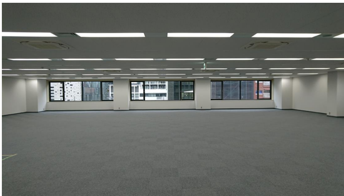
今後の成長を見据え、旧オフィスの4倍の面積となったシニアジョブの新オフィス(内装未施工の状態)