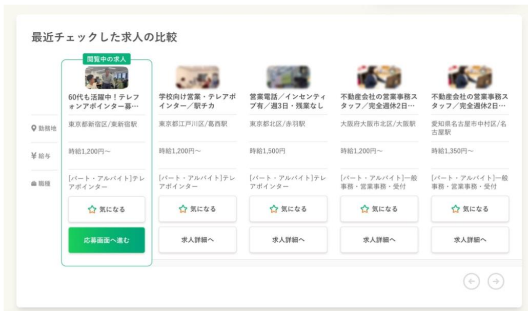
シニア専門求人サイト「シニアジョブ」に追加されたシニア求職者向けの新機能・最近チェックした求人の比較

左から、チェックした時期が新しい順に求人が並び、上から勤務地、給与、職種の順に表のように整理されて表示されるため、給与の比較などが簡単にできます。ボタン1つでカジュアル面談につながる「気になる」の意思表示や、詳細ページへの表示ができます。