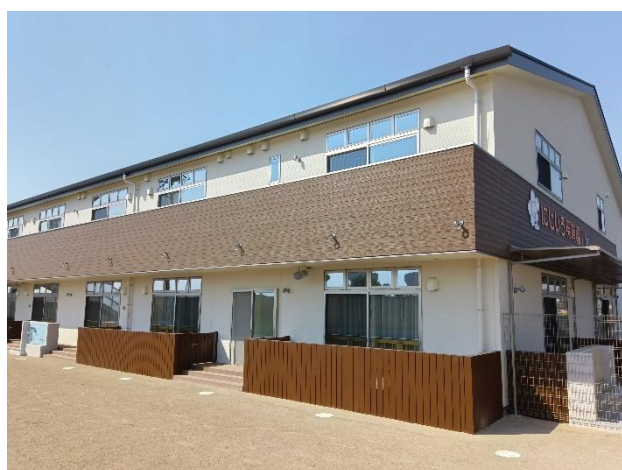
▲にじいろ保育園旭

多くの子どもたちが放課後や長期休みの居場所として利用でき、保護者の皆様が安心して働けるよう今後も保育の受け皿拡大に貢献してまいります。