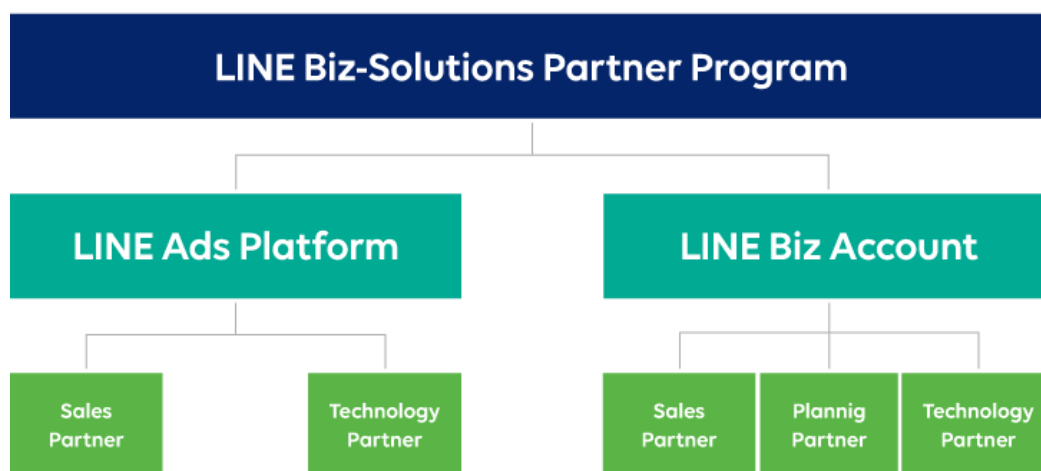
「LINE Biz-Solutions Partner Program」概要

*「LINE Biz Account」は「LINE 公式アカウント」「LINE ビジネスコネク」 「LINE カスタマーコネク」の総称です。