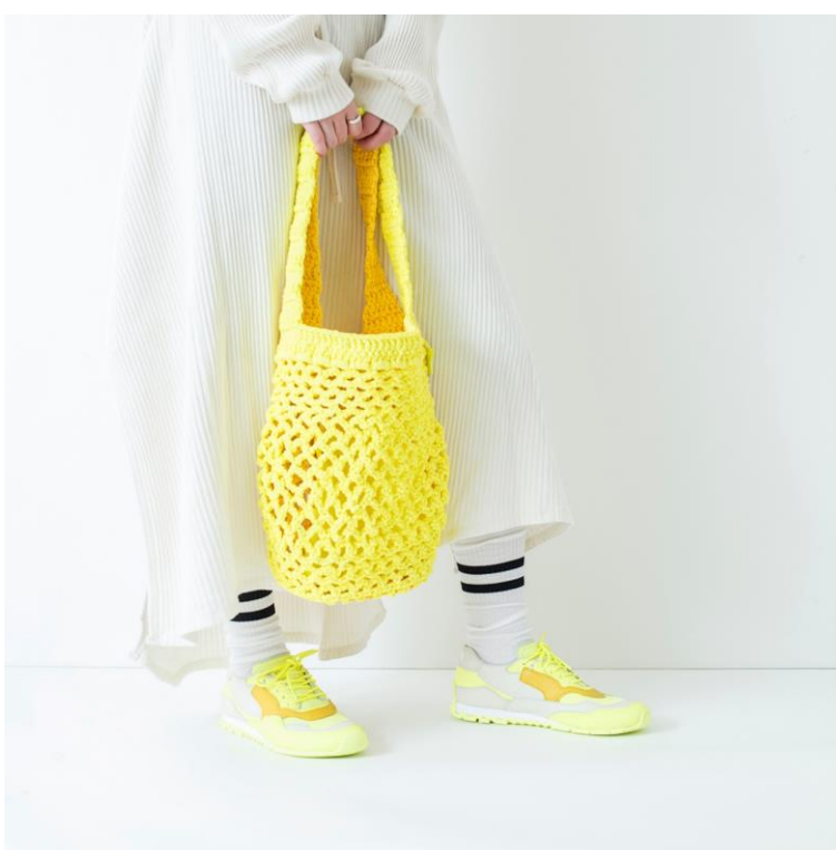
使用アイテム：NOTHING(ナッシング)