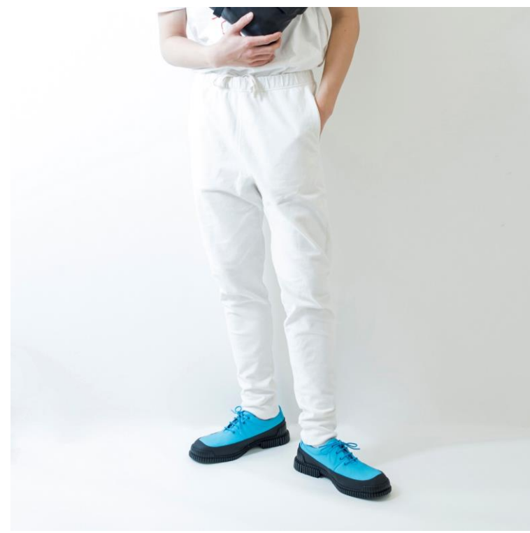
使用アイテムPix(ピクス)