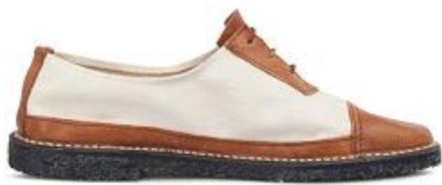
▲カンペール初めてのシューズ

カンペールは、スペインのマヨルカ島で生まれたコンテンポラリー・シューズブランド。4世代に渡る靴職人の家系であるフルーシャ・ファミリーはクラフトマンシップの知識と伝統を継承してきました。「カンペール」は3代目ロレンソ・フルーシャが創設し、クリエイティビティーあふれるデザイン、高品質な素材づくり、靴作りの伝統を守りながらも革新的な技術で型にはまらない世界観を発信しています。マヨルカ島の内陸部にある「インカ」という街は“靴生産地”として知られており、多くのシューメーカーや靴職人がその土地から輩出されています。