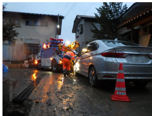
冠水車両を救援する特別支援隊（イメージ）