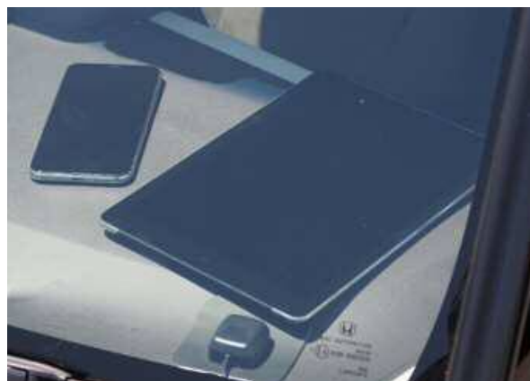
スマートフォンとタブレット