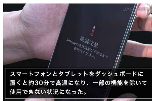
スマートフォンの高温注意表示

また、ダッシュボードの上に置いたスマートフォンとタブレットは、どの車両も約30分で高温になり一部の機能を除いて使用できない状況になりました。