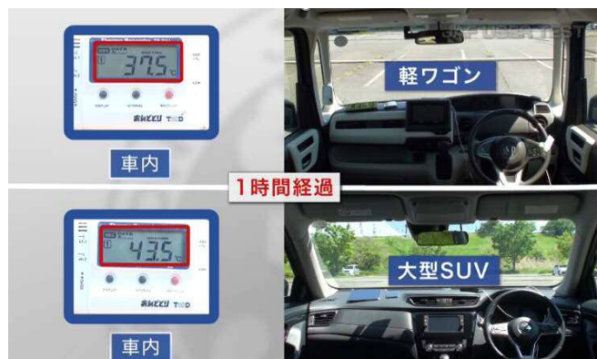
軽ワゴンと大型SUVの1時間後の様子