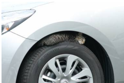
タイヤの上でつろぐ猫（イメージ）

ご依頼の中には「エンジンルーム下部のアンダーカバーの上に猫が4匹生まれていた」というものがありました。雨風がしのげる暖かい空間は、母猫にとって子どもを生む良いスペースだったのでしょう。駐車場の周りでよく猫を見かける、長い間クルマに乗っていなかったという場合はエンジンルーム付近を叩くだけでなく、ボンネットを開けて確認することをお勧めします。いつの間にか、ご自身の愛車が子猫のふるさとになっているかもしれません。