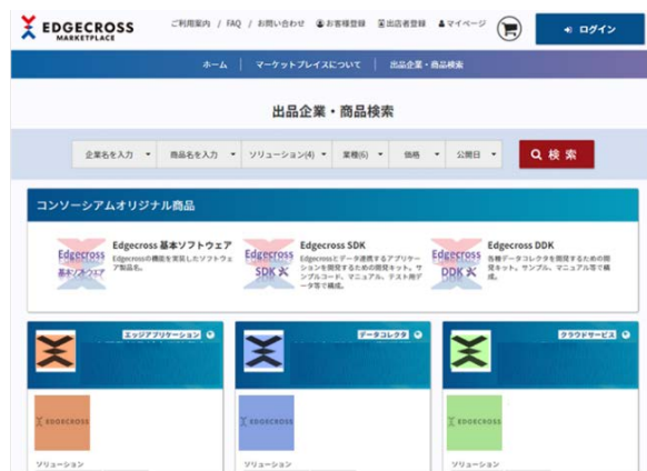
Edgecross マーケットプレイスのイメージ