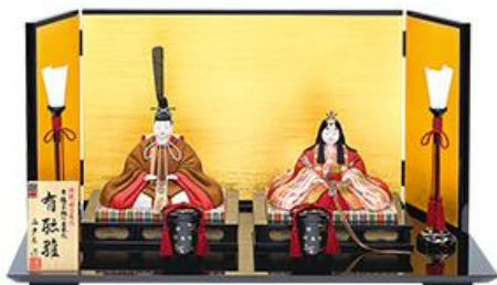
Lサイズ/正絹 253,000円 (税込)