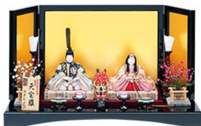
Sサイズ/本金 165,000円 (税込)