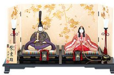
LLサイズ/本金 297,000円 (税込)