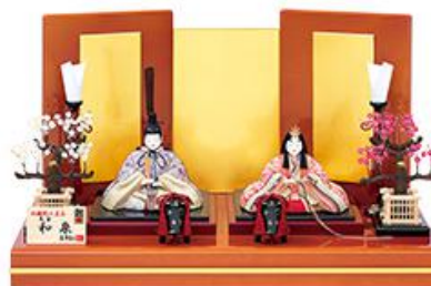
Mサイズ/本金 220,000円 (税込)