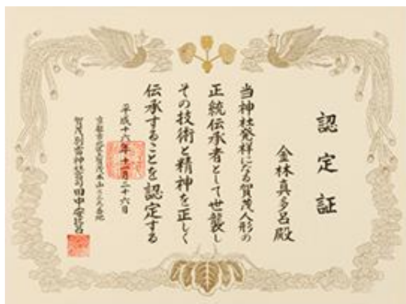
上賀茂神社による木目込み人形 正統伝承者の認定証