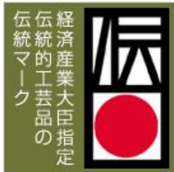
経済産業大臣指定 伝統的工芸品のマーク