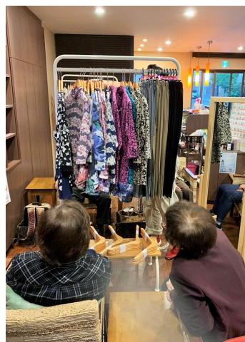
▲衣料品販売 デイサービス店内で直接見て、触って購入いただけます。