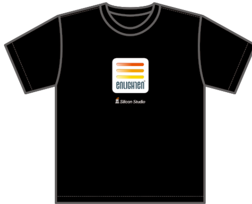
Enlighten ロゴ入りオリジナルTシャツ

名称： UNREAL FAEST WEST 2019 会期： 2019年4月20日（土） 会場： 京都コンピュータ学院 京都駅前校 主催： Epic Games Japan 公式サイト： http://unrealengine.jp/unrealfest/