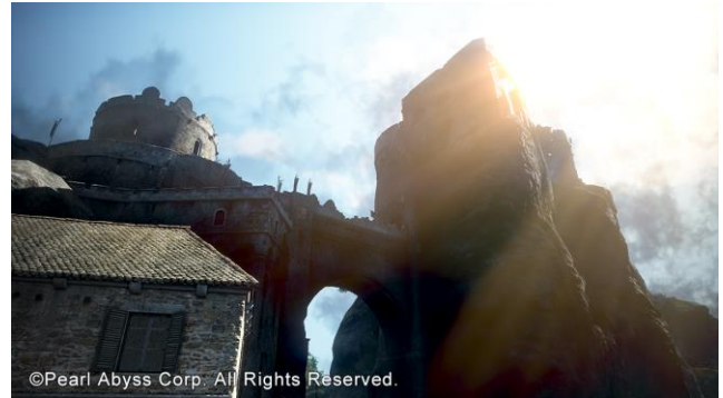
左：リマスタリング前／右：リマスタリング後