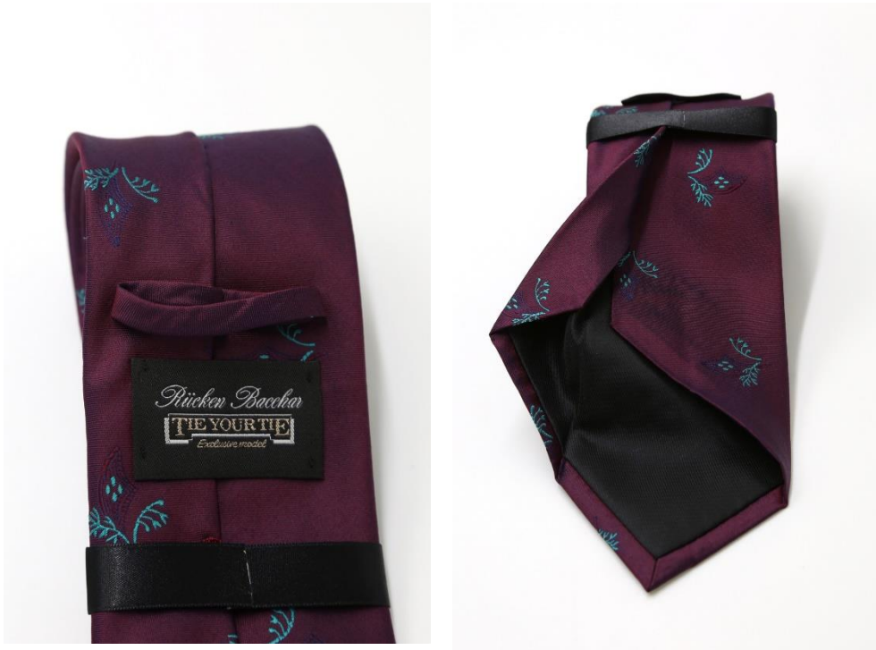
写真左: TIE YOUR TIE を彷彿とさせる職人たちの技術力の高さを表す細いリレープ 写真右: 深折り・深合せの技法ならではの贅沢な生地使いと高い門止め位置