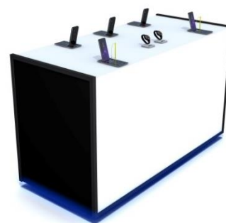
<Touch & Try>